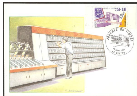
« Les Métiers de la Poste »