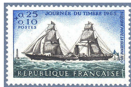
Paquebot-Poste « La Guienne » de 1860 Journée du Timbre 1965