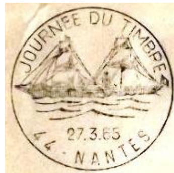
1 er timbre à date en Loire-Atlantique pour la Journée du Timbre, 27 mars 1965, à Nantes

1972 à 1973 Nantes 1974 Guéméné-Penfao 1975 Saint-Nazaire 1976 à 1977 Nantes 1978 Rezé 1979 Guéméno-Penfao 1980 Nantes 1981 Saint-Nazaire 1982 Nantes 1983 Vertou 1984 Bouguenais 1985 La Baule 1986 Rezé 1987 Saint-Herblain 1988 Guéméné-Penfao 1989 Saint-Nazaire