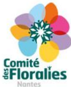
Logo du Comité des Florales de Nantes

« Les Florales internationales - Nantes constituent l'une des plus grandes manifestations florale et horticole d'Europe organisées à Nantes. Cet événement accueille à chaque édition plus de 200 exposants ornementaux, professionnels et amateurs venant des quatre coins du monde, qui créent pour l'occasion des réalisations florales et des scènes paysagères. Ces Florales Internationales rassemblent plusieurs centaines de milliers de spectateurs.